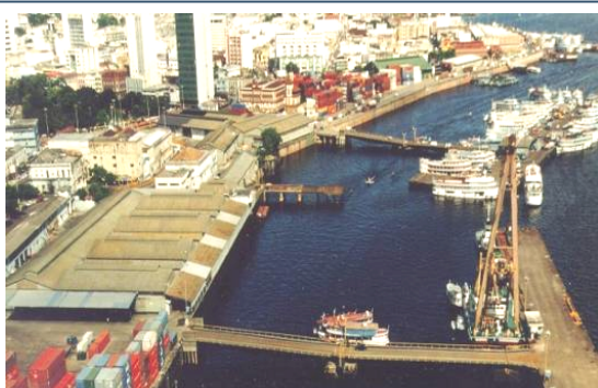
Projeto: Porto Organizado de Manaus

Descrição: Elaboração do Projeto Básico e do Projeto Executivo de engenharia, arquitetura, urbanismo, paisagismo e instalações para realização de obras de recuperação estrutural das pontes de acesso e dos cais flutuantes de atracação ("Cais das Torres" e do "Cais do Roadway"), além de obras de restauração, adequação e modernização da área retroportuária do Porto de Manaus